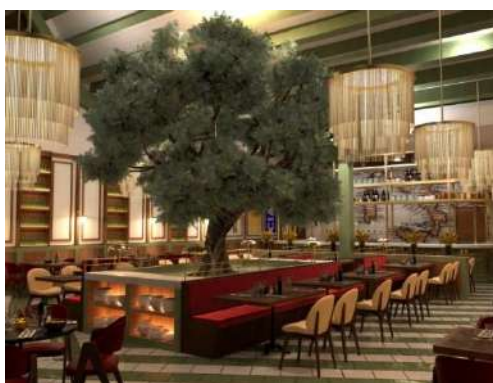
LA LOCANDA (Ocean Coral Spring)