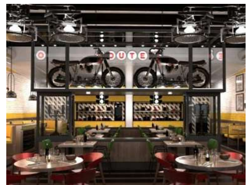
ROUTE 66 (Ocean Coral Spring)