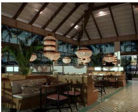
RED SNAPPER (Ocean Coral Spring)