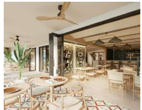
TERRASSE RESTAURANT PRIVILEGE