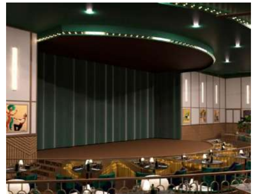
SENSES DINNER SHOW