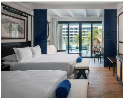
JUNIOR SUITE COM VISTAS PARA A PISCINA