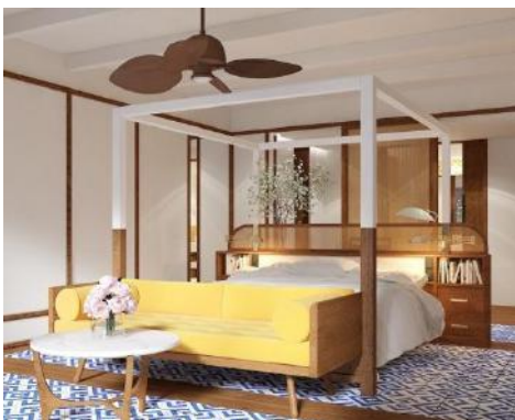
MASTER SUITE - DORMITÓRIO