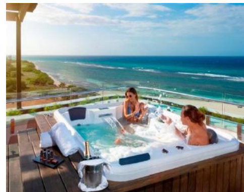
PRIVILEGE ROOFTOP MASTER SUITE