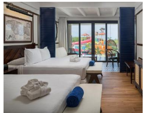
JUNIOR SUITE FAMILIAR DAISY