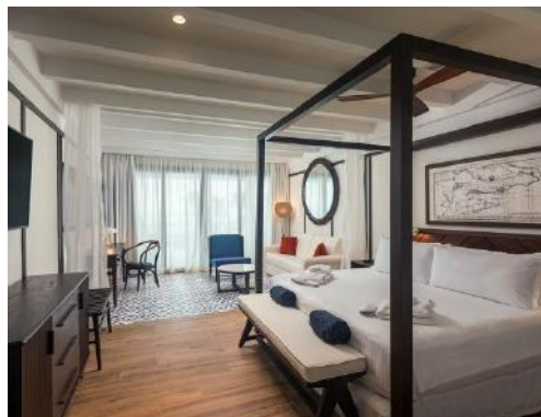
JUNIOR SUITE PRIVILEGE