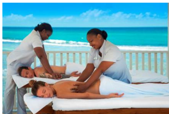
MASSAGENS AO AR LIVRE