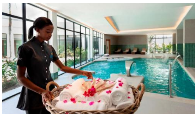
PISCINA INTERIOR DINÂMICA

As crianças, acompanhadas por um adulto, podem ter acesso apenas aos seguintes serviços: massagens, cabeleireiro e manicure. As restantes instalações do spa não permitem o acesso a crianças.