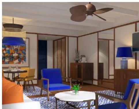
MASTER SUITE - SALON