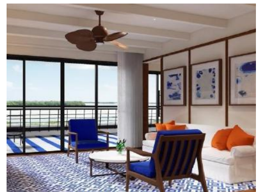
MASTER SUITE - SALON