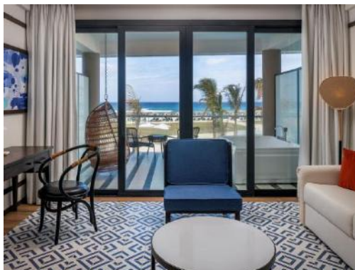
JUNIOR SUITES PRIVILEGE AVEC VUE SUR LA MER