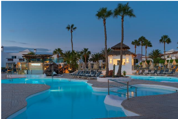
POOL MIT SONNENTERRASSE

Es bietet den ganzen Tag über Unterhaltung mit professionellen Darbietungen, Shows am Abend und tagsüber sowie Aktivitäten, die sich an ein erwachsenes Publikum richten.