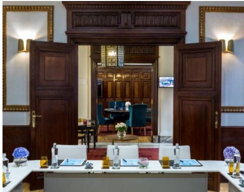
MURILLO & VELÁZQUEZ