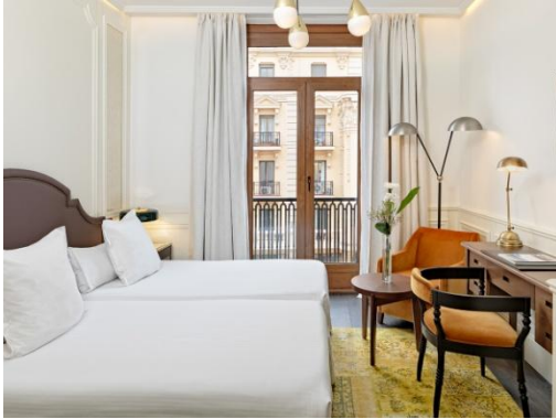
CLASSIC ZIMMER GRAN VÍA

Classic Zimmer Gran Vía: Komfortable Zimmer (22 m 2 ) mit Blick auf die Gran Vía. Ausgestattet mit zwei Einzelbetten mit den Maßen 1 x 2 m oder einem Bett mit den Maßen 1,50 x 2 m (je nach Verfügbarkeit). Geeignet für bis zu 2 Personen.