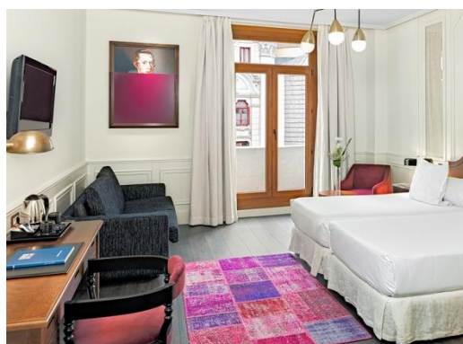
GRAND DELUXE ZIMMER

Grand Deluxe Zimmer: Helle Zimmer (24 m 2 ) mit einem französischen Balkon und Blick auf die Gran Vía. Ausgestattet mit einem Kingsize Bett (2 x 2 m) oder zwei Einzelbetten mit den Maßen 1 x 2 m und einer zusätzlichen Schlafsofa mit den Maßen 1,35 x 1,90 m. Neben den Services, die für die übrigen Zimmer gelten, finden Sie hier außerdem: