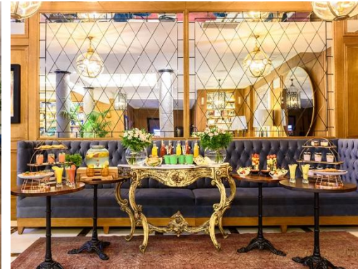
COFFEE-BREAK IN DER LOBBY