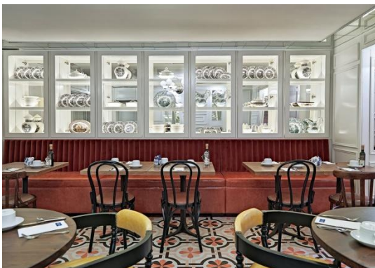
RESTAURANT LAS INFANTAS

Restaurant Las Infantas: In der sehr zeitgemäß gestalteten Umgebung, die ein wenig an die Küche zu Hause erinnert, erwartet den Gast ein umfangreiches Frühstücksangebot mit mehr als 60 verschiedenen Produkten, zu denen auch glutenfreie und diätetische Optionen zählen.