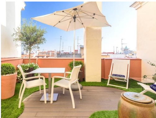
DELUXE TERRACE ZIMMER

Deluxe Zimmer: Zimmer (24 m 2 ) mit Blick auf die Seitenstraße, auf den Hotelinnenhof oder auf die Gran Vía. Ausgestattet mit zwei Einzelbetten mit den Maßen 1 x 2 m und einer Schlafsofa (90 cm). Geeignet für bis zu 3 Personen.