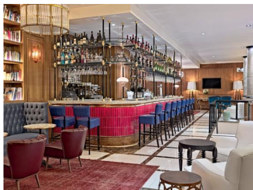
BAR LA VILLA

Bar La Villa: In der eleganten Bar des Hotels in der Lobby gibt es eine Auswahl köstlicher leichter Gerichte, wie Salate, Sandwichs und Tapas, und auch Cocktails. Die umfangreiche Bibliothek der Lobby-Bar steht allen unseren Gästen offen.