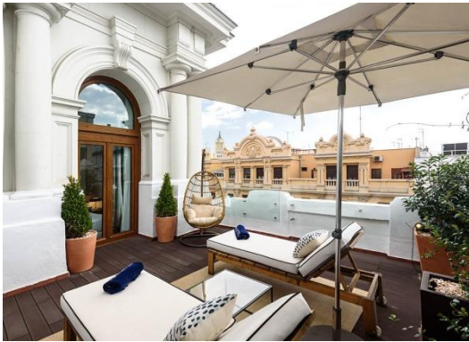
JUNIOR SUITE TERRACE

Junior Suite Terrace: Exklusives Zimmer (35 m 2 ), bestehend aus einem Schlafzimmer mit einem Kingsize Bett (2 x 2 m), einem Wohnzimmer und einer großzügigen, möblierten Terrasse (25 m 2 ) mit Blick auf die Gran Vía. Außerdem sind folgende Annehmlichkeiten verfügbar: