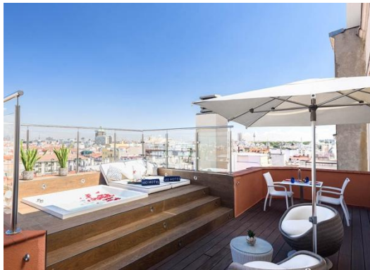
SUITE TERRACE JACUZZI

Suite Terrace Jacuzzi: Eine prachtvolle Suite (46 m 2 ), bestehend aus einem Schlafzimmer mit Kingsize Bett (2 x 2 m), Wohnzimmer mit Bibliothek und einer großzügigen, möblierten Terrasse (25 m 2 ), die neben einem Whirlpool auch beeindruckende Ausblicke auf die Stadt bietet. Folgende Serviceleistungen sind ebenfalls verfügbar: