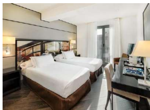
CAMERA DELUXE BALCONY

Camere Classic: eleganti camere di 21 m 2 con vista su un cortile tipico barcellonese. Sono dotate di letto King Size (2 x 2 m) o due letti singoli (1 x 2 m) e ospitano 2 adulti con 1 bebè.