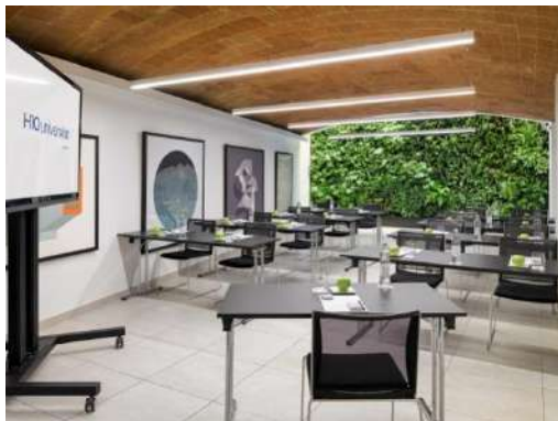
SALA RAMBLA – DISPOSIZIONE A CLASSE