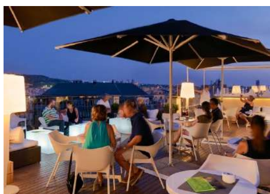
TERRAZZA TWENTY ONE

Offre una selezione di snack e cocktail deliziosi.