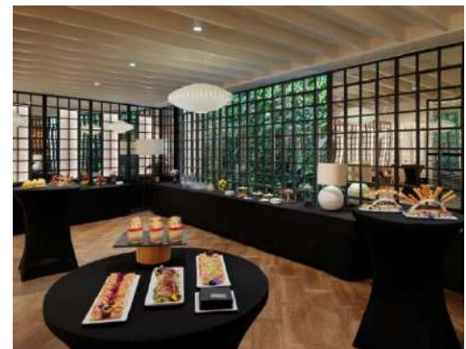
RISTORANTE URBAN – COCKTAIL