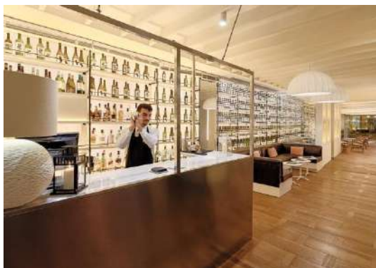
LOUNGE BAR MOMENTS

Lounge Bar Moments: situato nell'atrio dell'hotel, è il posto ideale per bere un drink o prendere un caffè in qualsiasi momento della giornata.