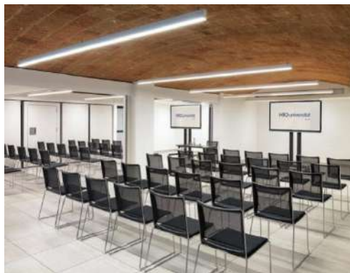
SALA RAMBLA CATALUNYA – DISPOSIZIONE A TEATRO