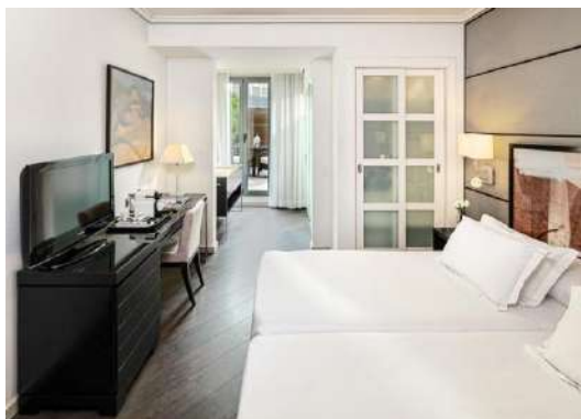
CAMERA CLASSIC TERRACE

Camere Classic Terrace: camere di 21 m 2 con un letto King Size di (2 x 2 m) o due letti singoli (1 x 2 m). Hanno una terrazza arredata di 12 m 2 con vista su un cortile tipico barcellonese. Possono ospitare 2 adulti con 1 bebè.