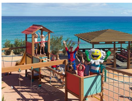
AIRE DE JEUX POUR LES ENFANTS