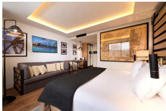
QUARTO DELUXE SUPERIOR

Quartos Deluxe: quartos amplos e luminosos de 30 m 2 com uma cama Queen Size (1,80 x 2 m) ou duas camas individuais de 1 x 2 m. Possibilidade de adicionar uma cama extra de 1 x 2 m.