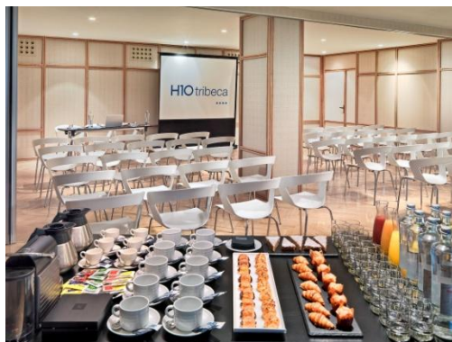
SALA AZCA & TEIXEIRA – MONTAGEM TEATRO