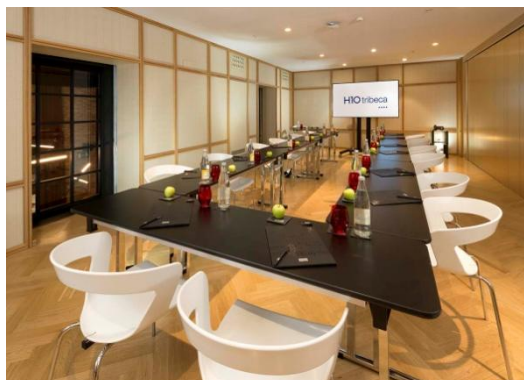
SALA AZCA – MONTAGEM EM “U”

* Capacidade máxima (ideal) de pessoas recomendada para estas salas e por tipo de evento.