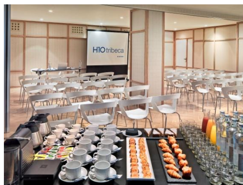
TAGUNGSRAUM AZCA & TEIXEIRA – THEATER-BESTUHLUNG