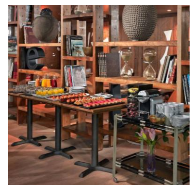
COFFEE-BREAK IN DER LOBBY