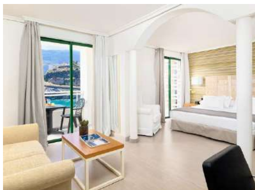
JUNIOR SUITE PRIVILEGE VISTA MARE

Junior Suites: spaziosi alloggi di 39 m 2 con camera, zona giorno e balcone con vista sulla strada e sulla piscina. Sono dotate di letto King Size (2 x 2 m) o due letti singoli da (1 m x 2 m). Sono dotate di un divano letto e possono ospitare 2 adulti con 2 bambini.