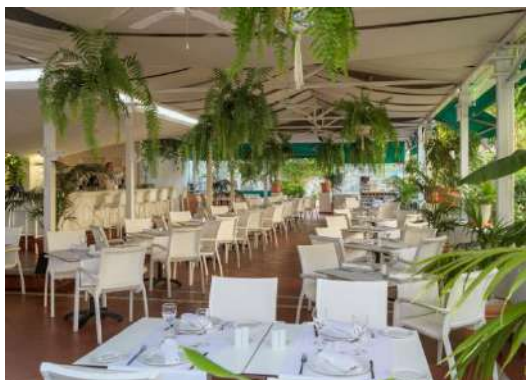
BAR RISTORANTE EL LAGAR

El Drago: ristorante a buffet con show cooking e grandi finestre con vista sul mare. Comprende una piacevole terrazza con spettacolare vista sul mare.