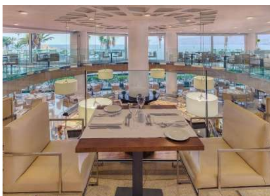
RISTORANTE EL DRAGO

El Drago: ristorante a buffet con show cooking e grandi finestre con vista sul mare. Comprende una piacevole terrazza con spettacolare vista sul mare.