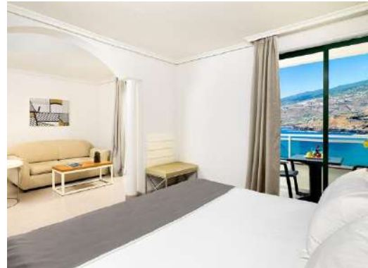
JUNIOR SUITE PRIVILEGE