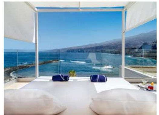
LETTINI BALINESI CON VISTA SUL MARE