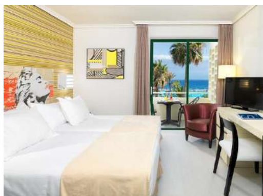
CAMERA DOPPIA VISTA MARE

Camere Basic: confortevoli camere di dimensioni più contenute che possono ospitare due persone. Hanno due letti singoli di 1 x 2 m. Si affacciano sulla strada oppure sulla piscina (non hanno balcone).