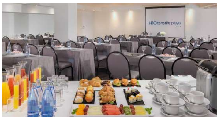
SALA TROPICAL – DISPOSIZIONE A CLASSE CON COFFEE-BREAK

*Capacità massima (ottimale) di persone che si consiglia per ciascun tipo di evento. Durante l'emergenza sanitaria la capienza sarà ridotta e gli allestimenti saranno volti a garantire il rispetto della distanza, della sicurezza e delle misure igieniche.