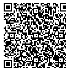
Aplicação web do hotel