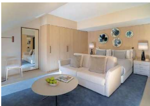
GRAND STUDIO SUITE

La Suite offre une vue sur la Rua das Portas de Santo Antão et peut accueillir jusqu'à 2 adultes et deux enfants (ou un troisième adulte).