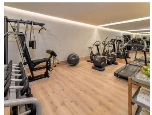
SALLE DE SPORT