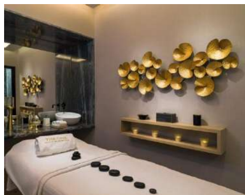
SALLE DE SOINS