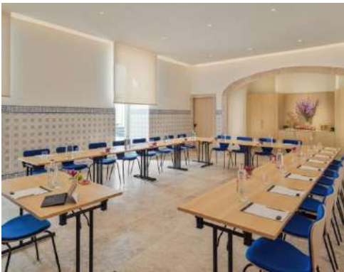
A ANTIGA COZINHA – DISPOSITION EN « U »