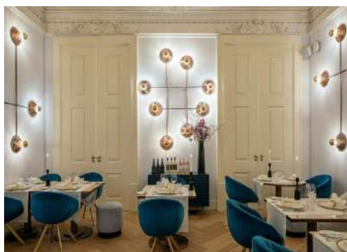
CONDES DE ERICEIRA

Condes de Ericeira: situé dans une des salles nobles du palais et avec un accès direct aux jardins, le restaurant Condes de Ericeira est un nouvel espace gastronomique de référence à Lisbonne.