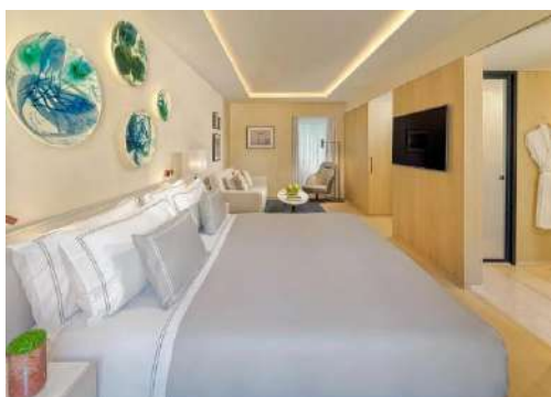
DELUXE FAMILY SECRET

Elles peuvent accueillir jusqu'à 2 personnes.