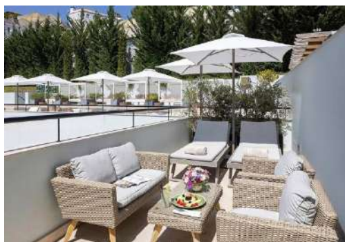
TERRACE GARDEN VIEW SUITE

Elles peuvent accueillir jusqu'à 2 adultes et offre une vue sur la Rue Portas de Santo Antão ou sur les jardins du palais.