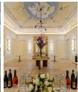
OS ESPELHOS – COCKTAIL