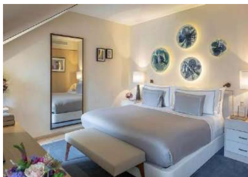
STUDIO JUNIOR SUITE

Elles peuvent accueillir jusqu'à 2 adultes et 2 enfants ou 3 adultes.