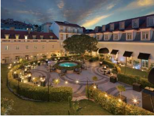
O JARDIM WINE BAR

O Jardim Wine Bar: présidé par un élégant bar circulaire, le O Jardim Wine Bar se trouve dans une autre salle noble du palais parfaitement rénovée pour récupérer la splendeur originale de son plafond à caissons et de ses grandes fenêtres. Il dispose également d'un accès direct aux jardins du palais.