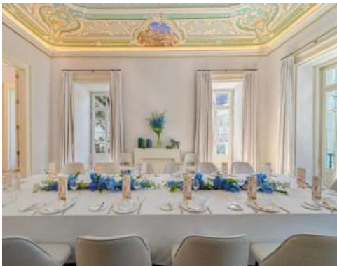
O DRAGOEIRO – BLOCKBESTUHLUNG

Die vier wunderschönen Veranstaltungsräume mit ihren großen Fensterfronten und Kassettendecken mit handgemalten Fresken eignen sich ideal für die Veranstaltung von Empfängen und Banketts in einer vornehmen und eleganten Umgebung und die weitläufige Gartenanlage bildet einen außergewöhnlichen Rahmen für unvergessliche Feierlichkeiten.