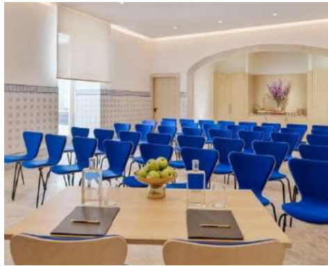
A ANTIGA COZINHA – THEATER-BESTUHLUNG