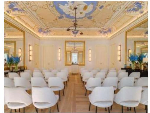
OS ESPELHOS – THEATER-BESTUHLUNG