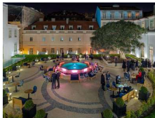
FEIER IN DEN GÄRTEN