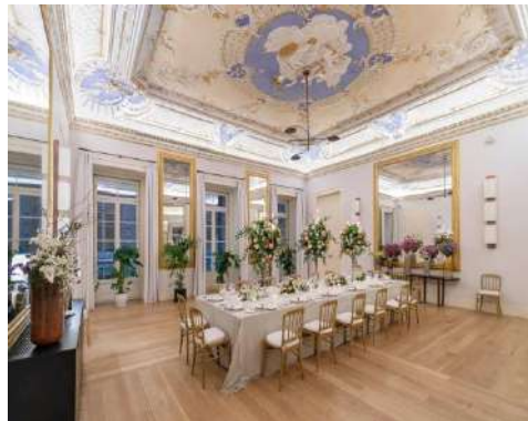
OS ESPELHOS – BLOCKBESTUHLUNG