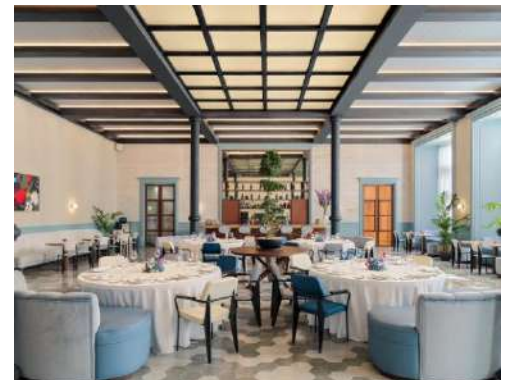
BOEMIO LOUNGE – BANKETT BESTUHLUNG