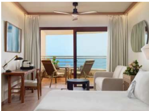
CAMERA PRIVILEGE - VISTA MARE

Camere Privilege: camere di 40,50 m 2 con balcone da 8,7 a 12 m 2 con vista sul mare o sulla piscina. Dispongono di due letti singoli di 1,05 x 2 m e di un divano letto di 0,90 x 1,80 m. Oltre ai servizi comuni alle altre camere, offrono anche: