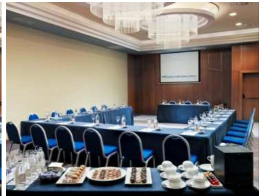
SALA MELONERAS – DISPOSIZIONE A FERRO DI CAVALLO