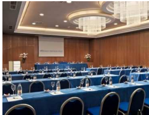
SALA BANDAMA – DISPOSIZIONE A CLASSE