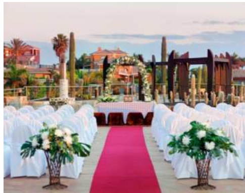
CERIMONIA SULLA TERRAZZA TIRAJANA