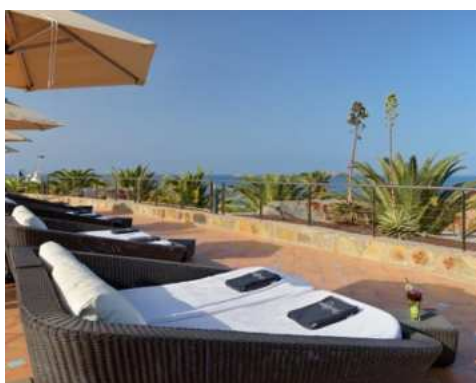
TERRAZZA PRIVILEGE CON VISTA SUL MARE