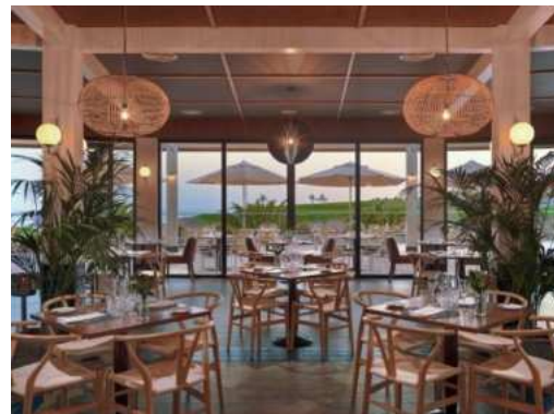
NATURALIA E LA BRASSERIE