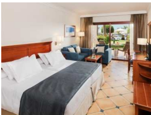
CAMERA DOPPIA – VISTA GIARDINO

TV a schermo piatto con canali internazionali Minibar (pagamento a consumazione) e bottiglia d'acqua gratuita all'arrivo Cassaforte gratuita Accappatoio e ciabatte Aria condizionata Bagno completo con asciugacapelli, specchio cosmetico e bilancia Dispenser ecologici della collezione Earth Collection