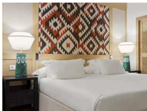
CAMERA DELUXE SUPERIOR VISTA MARE

Possono ospitare fino a 3 adulti oppure 2 adulti con 1 bambino.