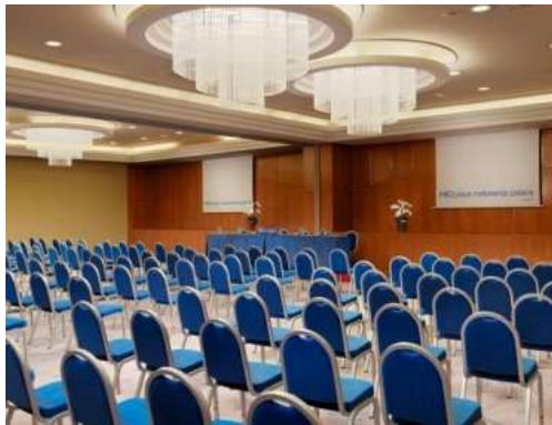
SALA GRAN CANARIA E BANDAMA – DISPOSIZIONE A TEATRO