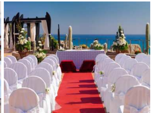
CERIMONIA DAVANTI AL MARE