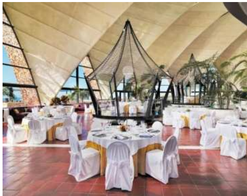
BANCHETTO NELLA GRAN SALA TIRAJANA

All' H10 Playa Meloneras Palace curiamo ogni dettaglio perché il Suo ricevimento sia come l'ha sempre sognato. L'hotel è situato in un ambiente unico e offre spazi esclusivi per cerimonie con spettacolare vista mare.