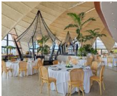
BANCHETTO PRESSO L'AMPIA SALA TIRAJANA

All' H10 Playa Meloneras Horizons Collection curiamo ogni dettaglio perché il Suo ricevimento sia come l'ha sempre sognato. L'hotel è situato in un ambiente unico e offre spazi esclusivi per cerimonie con spettacolare vista mare.