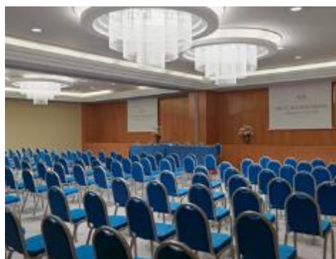
SALA GRAN CANARIA & BANDAMA DISPOSIZIONE A TEATRO