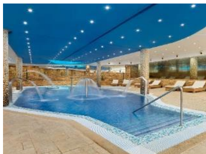
ZONA DELLE ACQUE

***Alcuni servizi sono soggetti a modifiche a seconda della stagione. Per maggiori dettagli, consulta l'hotel.