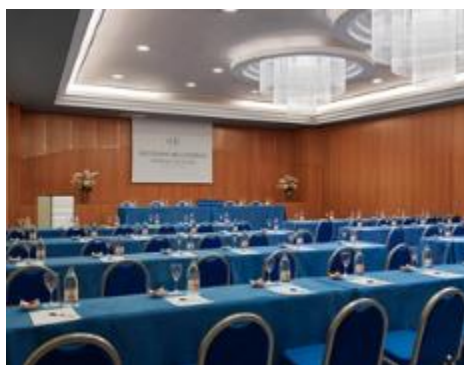
SALA BANDAMA DISPOSIZIONE SCUOLA