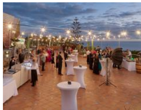
CELEBRAZIONE VISTA MARE