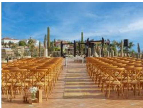
CELEBRAZIONE SULLA TERRAZZA TIRAJANA