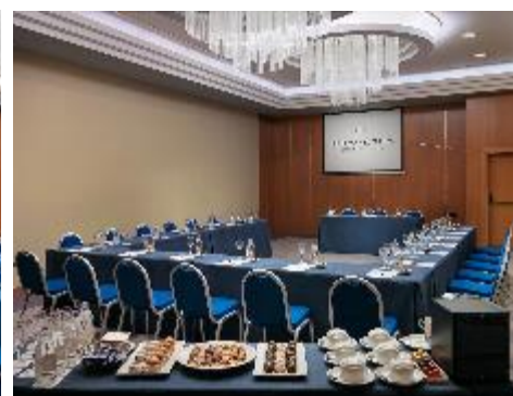
SALA MELONERAS DISPOSIZIONE A U