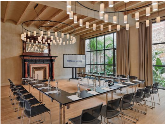
LES COTXERES - U