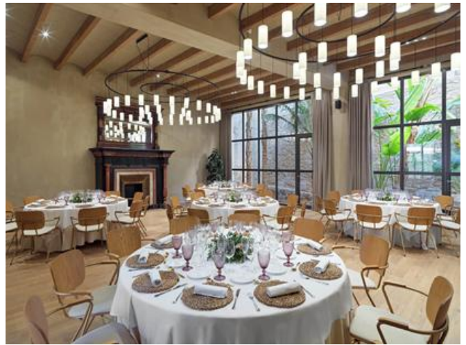
LES COTXERES - BANCHETTO