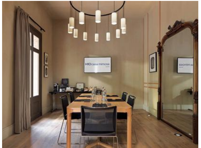
EL JARDÍ - IMPERIALE