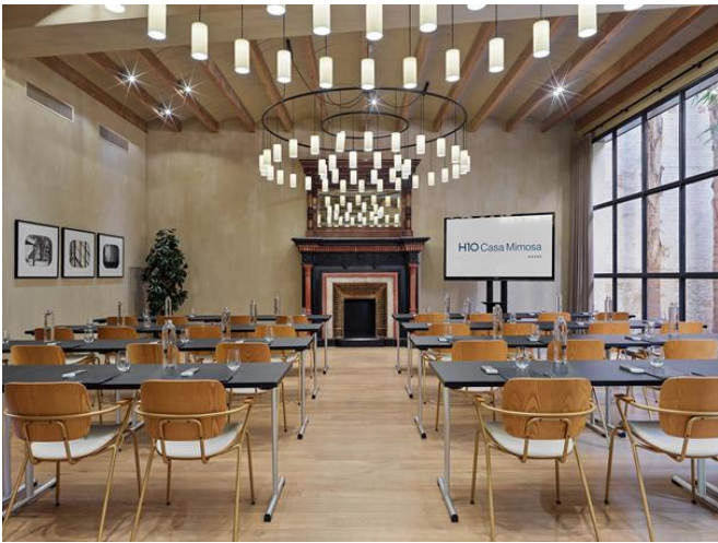
LES COTXERES - ÉCOLE