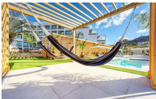
AIRE DE BRONZAGE LA RIVIERA BEACH CLUB

Boissons incluses selon menu avec la formule Tout Compris.