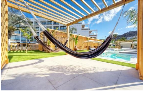
SONNENBADELANDSCHAFT LA RIVIERA BEACH CLUB

Alle Getränke auf der Karte des All-Inclusive-Programms.