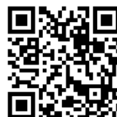
Web app hotel