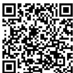
Sito web dell'hotel