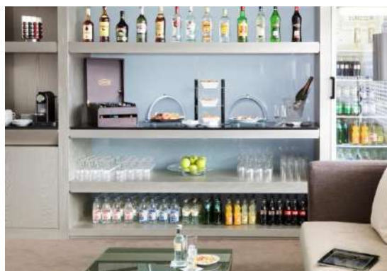
ANGOLO BAR SALA PRIVILEGE