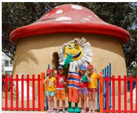
CASSETTA DAISY CLUB