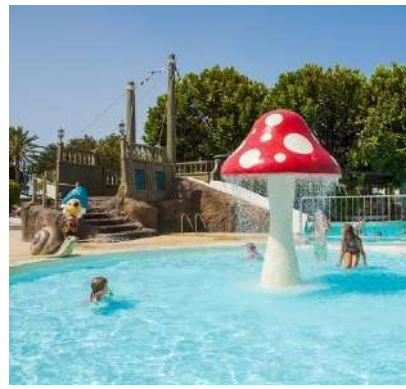
PISCINA PER BAMBINI