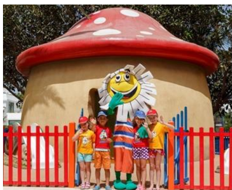
CASINHA DAISY CLUB