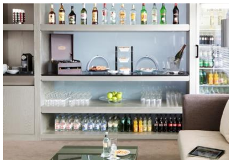
BAR SALON PRIVILEGE