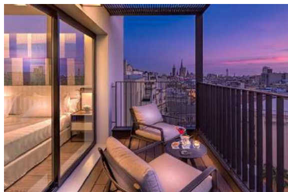
JUNIOR SUITE AVEC TERRASSE

Elles peuvent accueillir jusqu'à 2 adultes et 2 enfants ou 3 adultes.