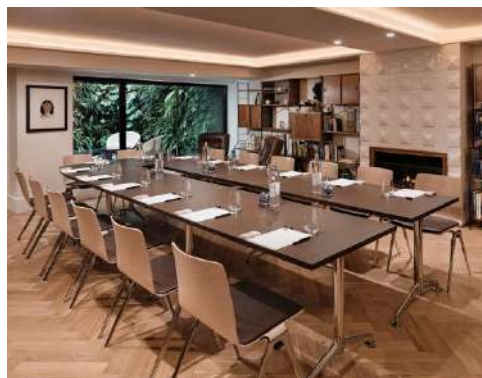
THE LIBRARY – DISPOSITION EN « U »