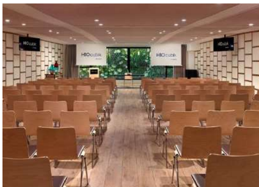
SALLE UNIK – DISPOSITION THÉÂTRE