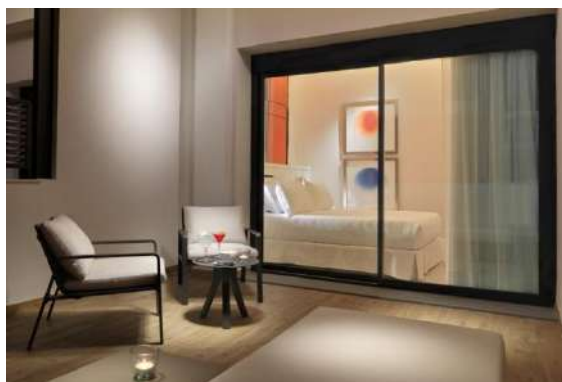
HABITACIÓN CLASSIC TERRAZA

Esta categoría dispone de habitaciones conectadas.