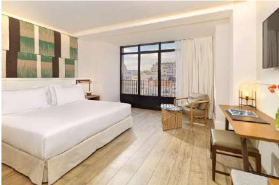
HABITACIÓN SUPERIOR BARCELONA

Habitaciones Superiores Barcelona: espaciosas habitaciones de 28 m 2 con amplios ventanales con vistas a la Via Laietana o a la Ciutat Vella. Disponen de una cama King Size (2 x 2 m) o dos camas individuales (1 x 2 m) y algunas de un sofá-cama (varias habitaciones de 0,90 x 1,90 m y en otras de 1,35 x 1,90 m). Pueden alojar hasta 2 adultos + 2 niños o 3 adultos.