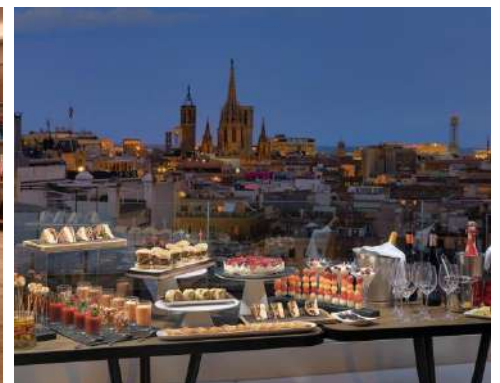
CÓCTEL EN LA TERRAZA ATIK