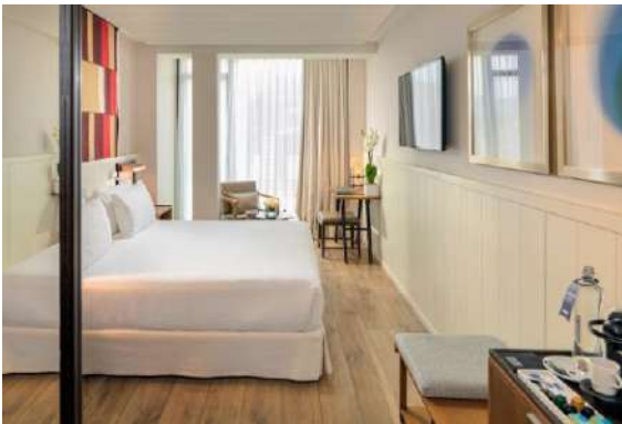
HABITACIÓN CLASSIC BARCELONA

Cuentan con una cama de matrimonio (en algunas habitaciones de 1,80 x 2 m y en otras de 2 x 2 m) o dos camas individuales (1 x 2 m) y pueden acomodar hasta 2 adultos.