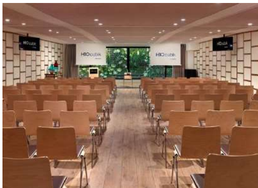
SALA UNIK – MUNTATGE TEATRE