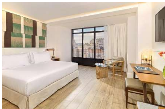
HABITACIÓ SUPERIOR BARCELONA

Habitacions Superiors Barcelona: espaioses habitacions de 28 m 2 amb amplis finestrals amb vistes a via Laietana o a Ciutat Vella. Disposen d'un llit King Size (2 x 2 m) o dos llits individuals (1 x 2 m) i algunes d'un sofà-llit (vàries habitacions de 0,90 x 1,90 m i en altres d'1,35 x 1,90 m). Poden allotjar fins a 2 adults + 2 nens o 3 adults.