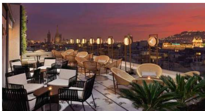
TERRASSA & BAR ATIK

Robotik Bar: situat al lobby, és un espai utilitzat per a realitzar esdeveniments de grups.