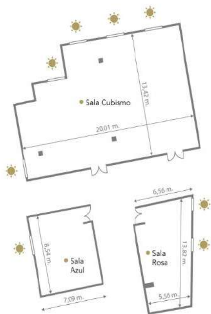
Área y Capacidad · Area and Capacity

*Informação provisória capacidade de pessoas para estas salas e por tipo de evento.