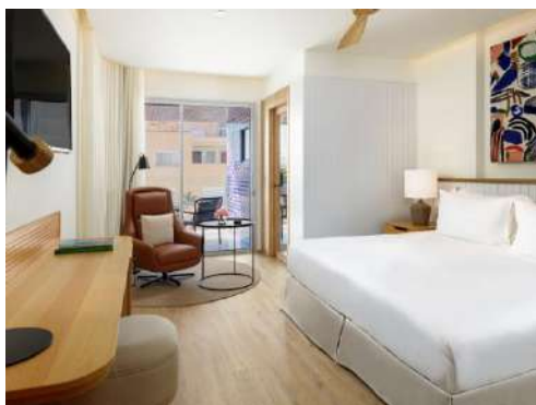
QUARTO DUPLO SUPERIOR

Quartos Duplos Superiores: quartos a partir de 25 m 2 com vistas para o centro de Málaga. Contam com um terraço privado original mobilado de design.