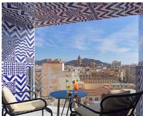
CAMERE DOPPIE SUPERIOR CATTEDRALE

Capacità massima degli alloggi: 2 adulti.