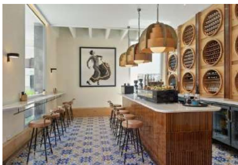
BAR LA MUNDIAL CON TERRAZZA

Lobby Bar: situato nella lobby dell'hotel, offre un ambiente piacevole dove prendere un caffè o degustare cocktail e spuntini.