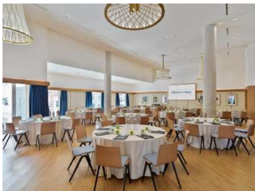
CUBISMO – DISPOSIZIONE CABARET