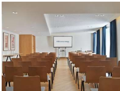
ROSA – DISPOSIZIONE CLASSE