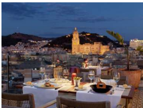
RISTORANTE ROOFTOP BAR

L'accesso al bar è possibile dalla lobby o dalla strada.