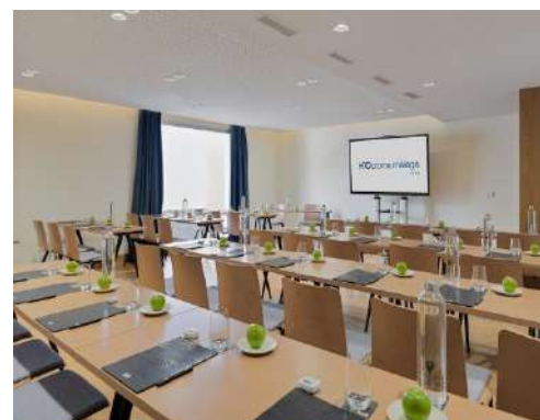
SALLE AZUL – DISPOSITION "U"