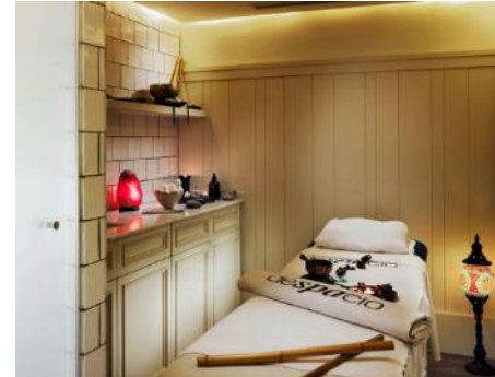
SALE PER TRATTAMENTI