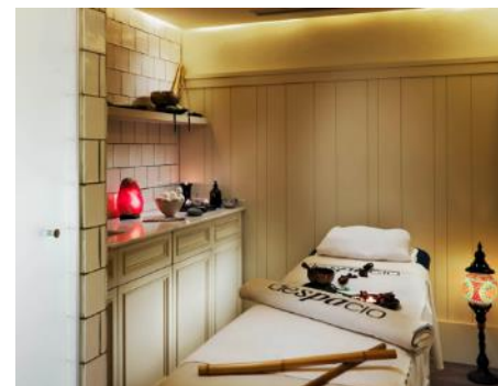
SALLE DE SOINS