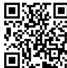
Application web hôtel