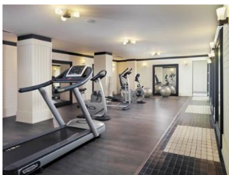
SALLE DE SPORT

Remarque : Certains services sont sujets à modification en fonction de la saison. Pour plus de détails, veuillez vous adresser à l'hôtel