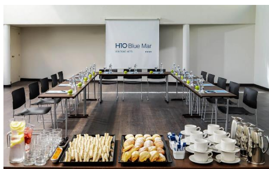
SA LLUM - U