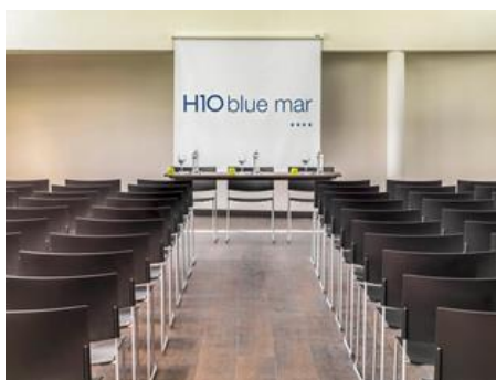
SA LLUM - THÉÂTRE