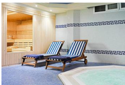
SAUNA ET JACUZZI

*Accès réservé aux personnes âgées de plus de 16 ans.