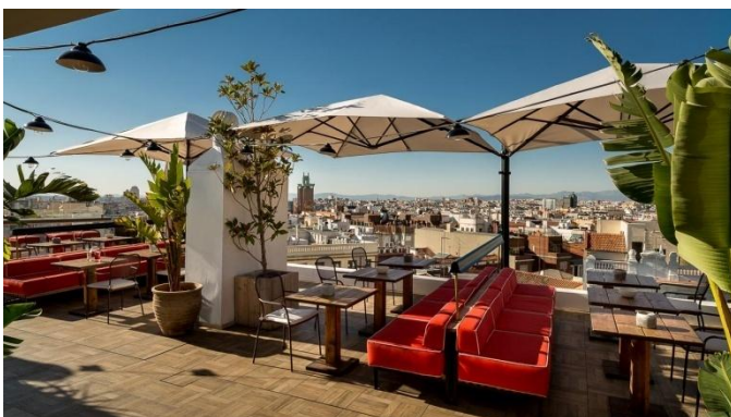
EL CIELO DE ALCALÁ

Lobby Bar El Mirador: abierto al mediodía y por la noche, dispone de grandes ventanales con vistas a la calle Alcalá. Especializado en cafés gourmet, ofrece también una selección de deliciosas tapas mediterráneas, tartas caseras y cócteles.