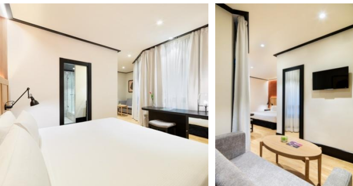
DORMITORIO Y ZONA DE ESTAR HABITACIÓN DELUXE

Cafetera Nespresso Albornoz y zapatillas Servicio de descubierta nocturna Detalle de bienvenida