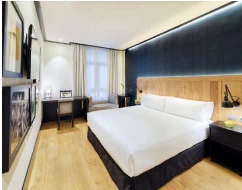
HABITACIÓN DOBLE CLASSIC

Habitaciones Basic: habitaciones de menores dimensiones que dan al patio interior del hotel. Disponen de una cama doble de 1,35 x 1,90 m.