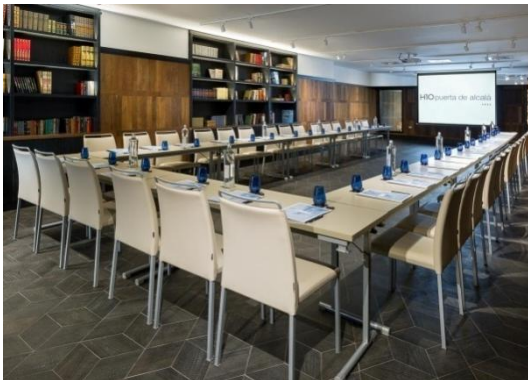
SALÓN CIBELES – MONTAJE “U”