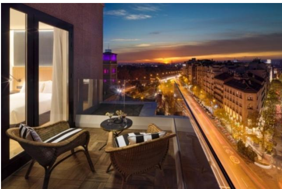
HABITACIÓN DOBLE CLASSIC TERRAZA

TV plana de 49" en el dormitorio y 32" en la zona de estar Cafetera Nespresso Albornoz y zapatillas Servicio de descubierta nocturna Detalle de bienvenida