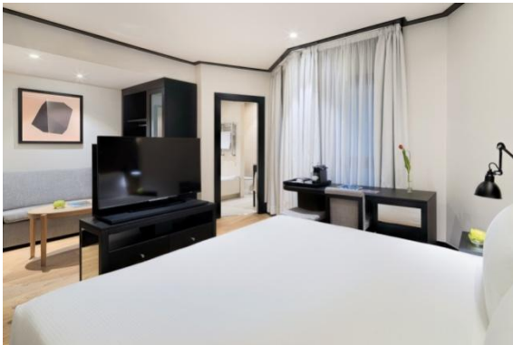
HABITACIÓN DOBLE SUPERIOR

Habitaciones Dobles Superiores: habitaciones de 25 m 2 que dan al patio interior del hotel. Disponen de una cama King Size (2 x 2 m) o dos camas individuales (1 x 2 m), además de un sofá-cama de 1,35 x 1,90 m en la misma estancia. Son una opción ideal para familias ya que pueden acomodar hasta 3 adultos o 2 adultos y 2 niños. Además de las comodidades comunes a las demás habitaciones, también ofrecen: