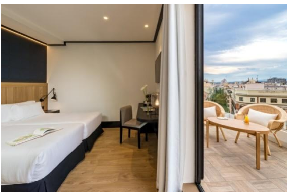
HABITACIÓN DELUXE TERRAZA

Cafetera Nespresso Albornoz y zapatillas Servicio de descubierta nocturna Detalle de bienvenida