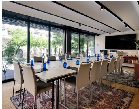
SALÓN EL MIRADOR – MONTAJE IMPERIAL