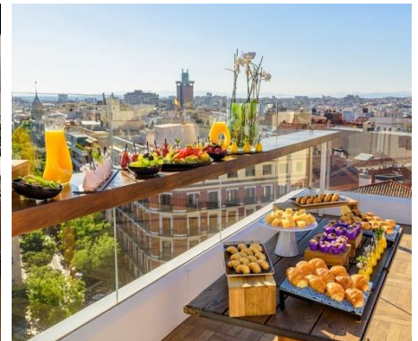
TERRAZA EL CIELO DE ALCALÁ