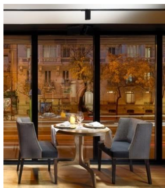
LOBBY BAR EL MIRADOR

Lobby Bar El Mirador: abierto al mediodía y por la noche, dispone de grandes ventanales con vistas a la calle Alcalá. Especializado en cafés gourmet, ofrece también una selección de deliciosas tapas mediterráneas, tartas caseras y cócteles.