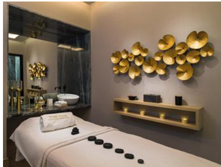
SALA DE MASAJES