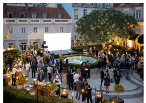
CELEBRACIÓN EN LOS JARDINES