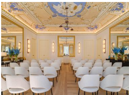
SALA OS ESPELHOS