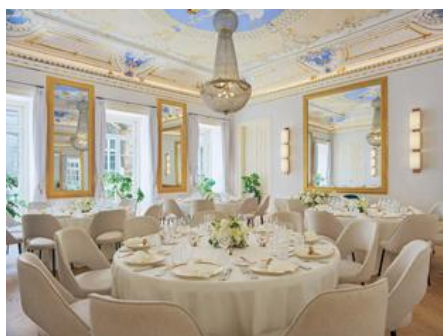
SALA OS ESPELHOS