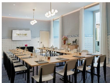
SALA A ANTIGA COZINHA